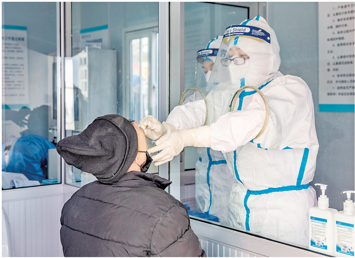
1月18日,群众在绛县人民医院核酸检测点接受检测取样。

“其实家庭用水中很少存在故意浪费的现象,有时就是设备本身不节水,推荐使用带有节水标识的龙头、马桶、洗衣机,可以极大提高节水量。”靳虎刚说,节水并不难,难的是有节水意识,不论是在平时生活中,还是在疫情期间,大家都要养成节水的好习惯,提高水的利用效率,减少水的使用量,增加废水的处理回用量,防止和杜绝浪费。