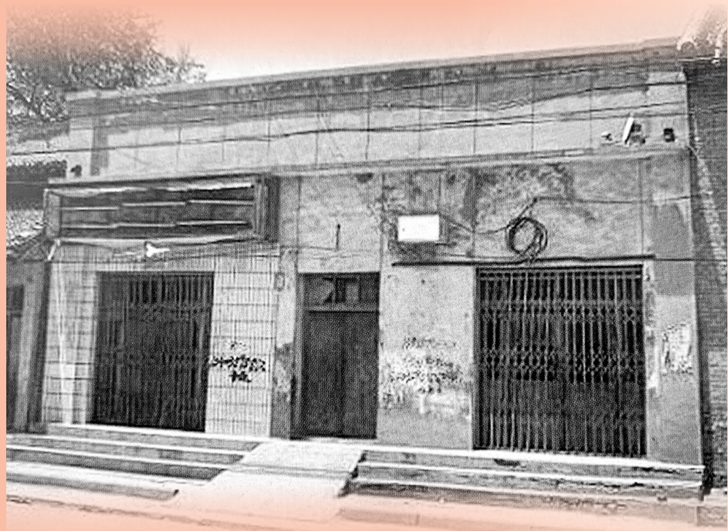
中共安邑县委旧址