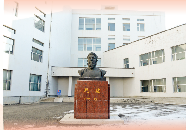
吉林市第一中学校内的马骏雕塑(1月14日摄)