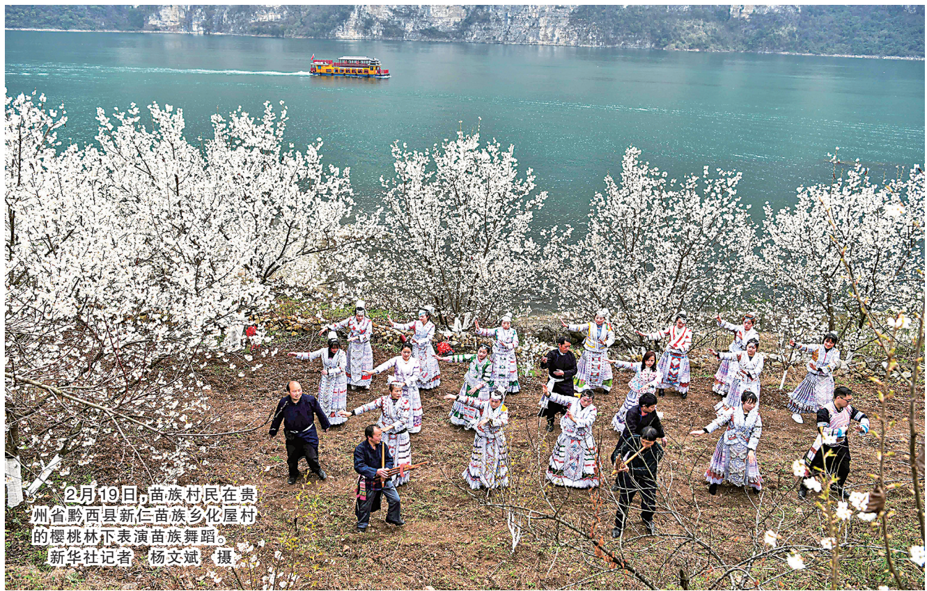
2月19日，苗族村民在贵州省黔西县新仁苗族乡化屋村的樱桃林下表演苗族舞蹈。