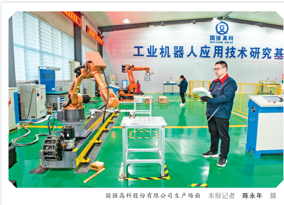
国强高科股份有限公司生产场面

新基建方面，有投资1亿元与中国移动合作建设、着力打造全省标杆的5G智慧园区，目前该园区核心区已实现5G信号全覆盖；有依托运城大数据中心，招引上下游企业，打造全市一流大数据产业园的中兴大数据产业园。新技术方面，有建立全国第一条高温传感器生产线和实验室，填补国内行业空白的润科科技高温传感器技术；有解决行业内行业领域关键技术问题，公司被确定为行业标准制定单位的立铂新材料单氧苯胺和ODPA生产工艺技术。新材料方面，有通过高新技术手段提取农业废弃物资源作为新型电池材料的嘉斯特锂电池硅碳负极材料；有生产的稀土永磁材料产量排名全国第三、单厂生产规模占据行业榜首的中磁科技永磁材料。新装备方面，有国强高科的工业