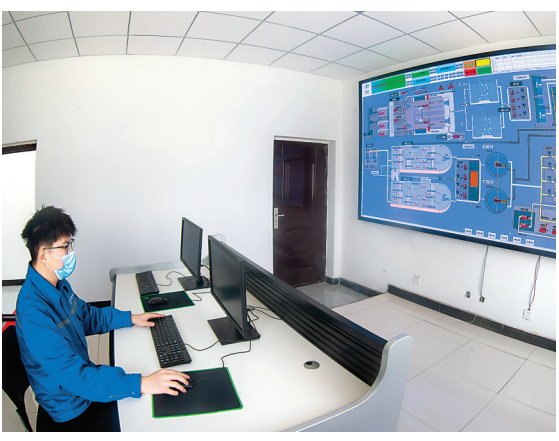
大工程项目——关公故里景区开发建设项目的配套设施。目前,该工程已完成主体建设和设备安装,正在进行自来水水质检测、粗细格栅、曝气、生化等设施设备联动调试和微生物菌群的培养,预计今年6月底可正式投入使用。