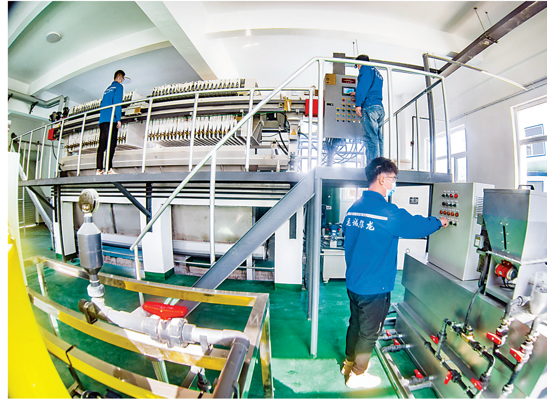
近日,盐湖区解州镇生活污水处理站,工人们在开展污水处理设施设备联动调试。盐湖区解州镇生活污水处理站是市“1311”重

过程监管;围绕项目落地,做好闲置土地清理、闲置厂房盘活等工作,确保引进来的项目能落地;迅速铺开2021年招商引资大行动,奋力冲刺一季度“开门红”。 (武咏梅)