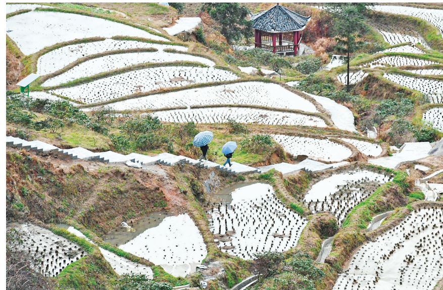
村民在湖南省怀化市溆浦县葛竹坪镇的山背花瑶梯田旁行走(3月8日摄)。

东风吹绿草,布谷劝春耕。华南农业大学的温室大棚里,一批经历过“星际旅行”的“天稻”种子,正在沉睡中苏醒。