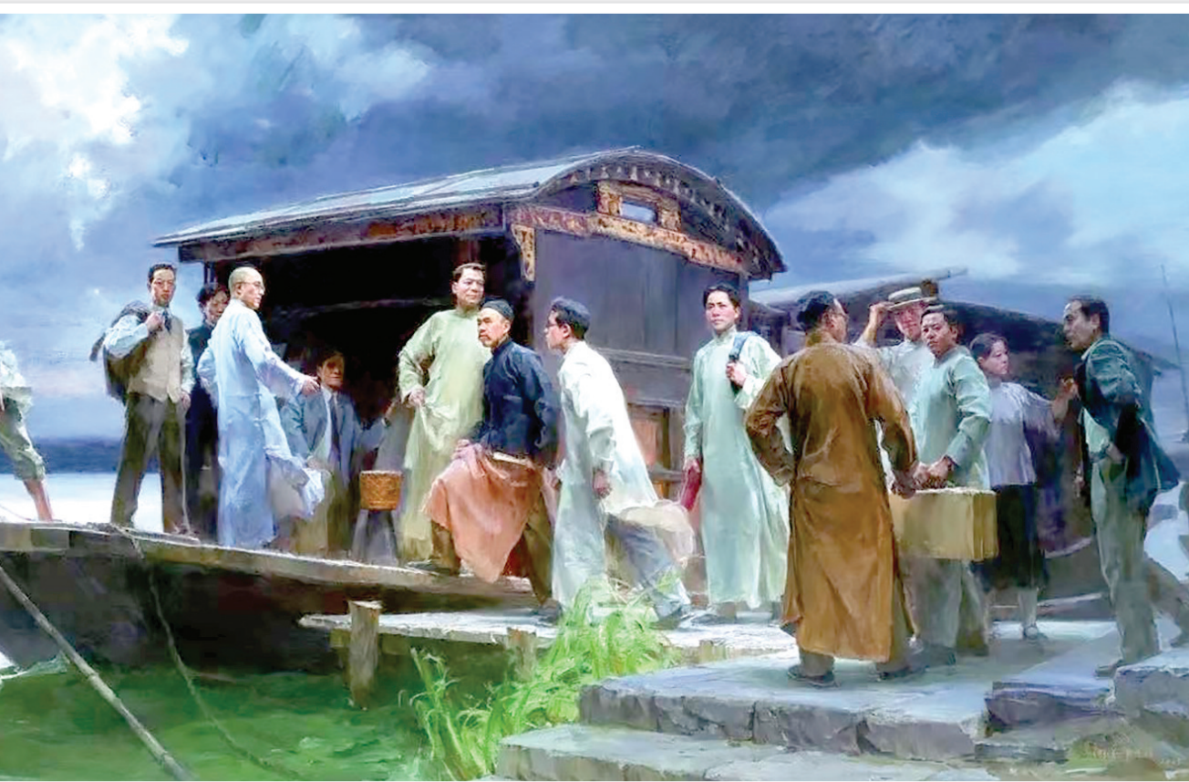
启航(浙江省重大历史题材美术创作工程获奖作品) 油画 何红舟 黄发祥 作 画面场景为代表们从湖边的跳板登船 浙江美术馆 藏

1950年，上海市市长陈毅提议，并经上海市委讨论决定寻找中共一大会议旧址。1951年，几经周折，中共一大会议旧址被找到，随后根据相关史料和亲历者的回忆，进行修复复原。1952年9月，中共一大会议址修缮完成，建立纪念馆并对外开放。