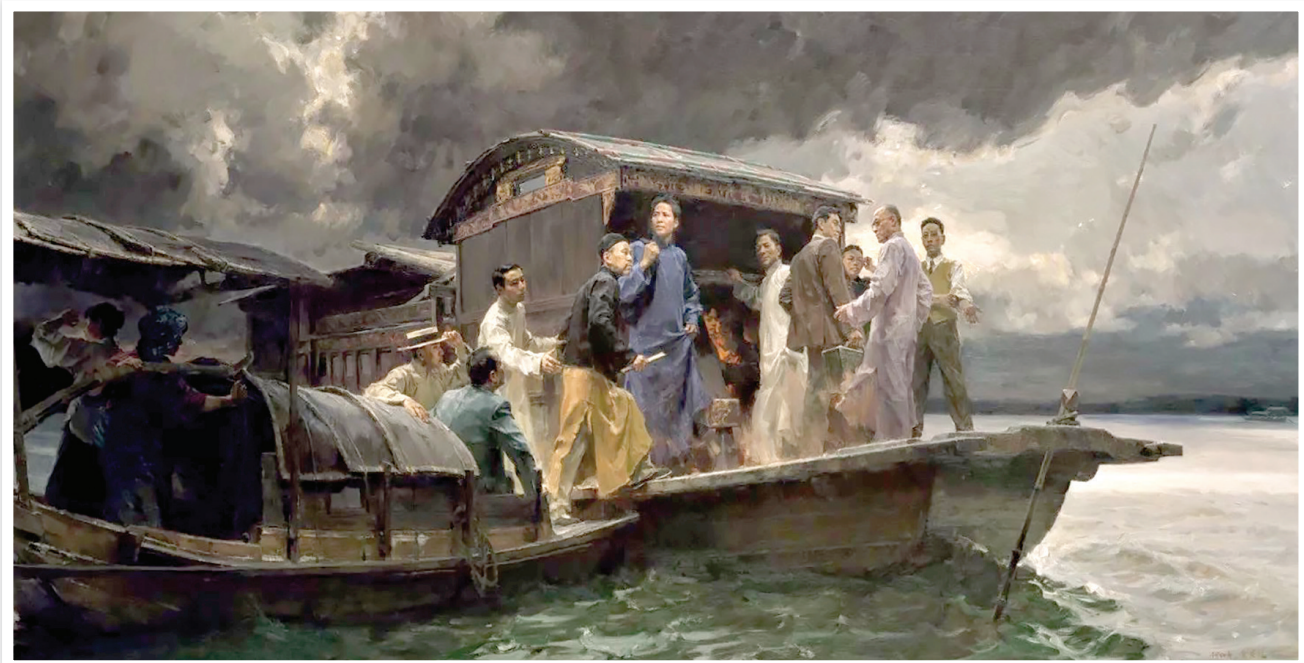
启航(国家重大历史题材美术创作工程入选作品) 油画 2009年 何红舟 黄发祥 作 画面表现的是中共一大代表乘小船陆续登红船

论，“一些代表，他们没有到南湖去，我们一边画还要一边考究历史材料，同时对一些党史专家提出的问题在画中去作出回应。比如党史专家一再对我强调的，毛泽东和董必武在这次会议中的重要地位。但又不能太过火，把毛泽东塑造为一大会议的主导者”。所以，在艺术表现手法上，何红舟动了一些脑筋，比如，毛泽东和董必武尽管处于画面的中心，但在处理上，毛泽东衣服的颜色稍暗一些，没有将他放在船头，而是放在了一个比较动态的位置上，确保了矗立在船头的一大会的几位中心人物依然显而易见。