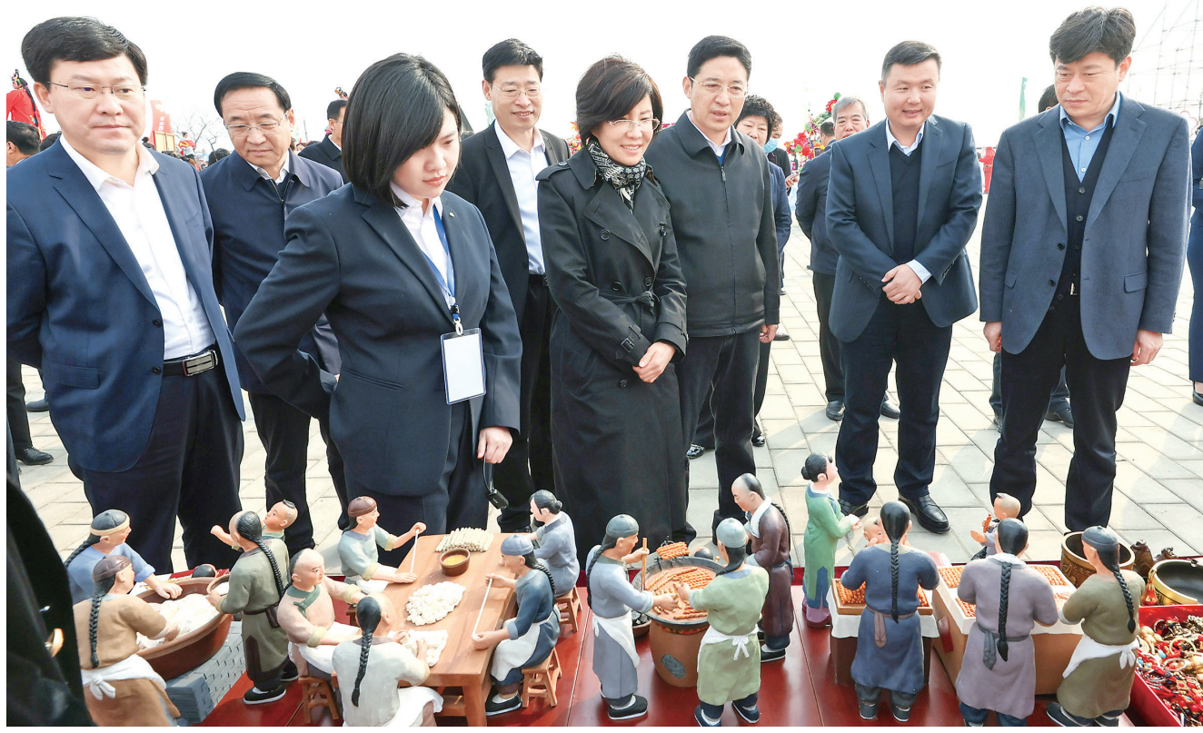
与会领导和嘉宾参观文创产品

启动仪式后，与会领导及嘉宾登上“咏梨台”远眺一望无际的如雪花海，步入梨园欣赏了茶艺、花艺、香道表演，聆听了古筝、古琴、琵琶演奏，了解了现代