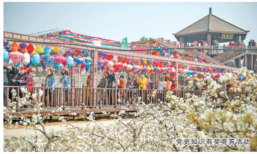
党史知识有奖竞答活动

据了解，第五届“花开盐湖”美丽乡村游系列活动以全域旅游发展理念为引领，以农文旅融合为主要形式，以高质量活动为载体，融入“游山西运城·读华夏历史”文化品牌节庆活动，聚焦盐湖区品牌营销，集中展示盐湖发展新气象、新作为、新风采，精心打造泓芝驿梨花节、陶村桃花节、王范韭花节等特色鲜明的农旅、文旅品牌，进一步提升乡村旅游标准化服务，带动当地农民增收致富；立足关帝庙景区、舜帝陵景区、凤山根·运城印象、凤凰山景区、乡遇·刘范民俗艺术村、上王乡牛庄村等景区（景点）开展赏百花、品小吃、购特产、娱乐体验、非遗文化进景区（景点）等一系列活动，助推盐湖区经济高质量高速度发展，以满足人民群众对文化旅游高品质生活的需求。