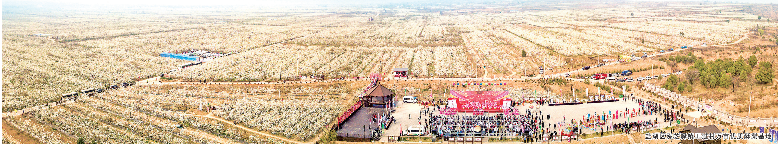
盐湖区泓芝驿镇王过村万亩优质酥梨基地