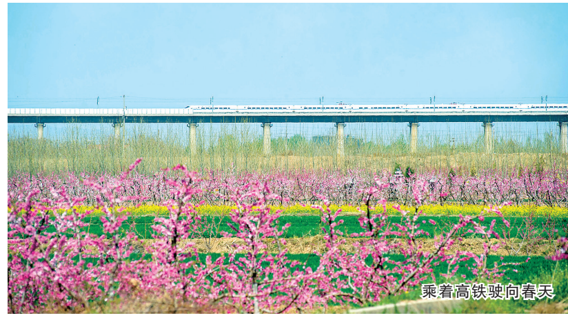
乘着高铁驶向春天