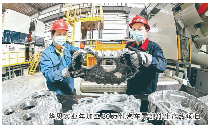
华恩实业年加工30万件汽车零部件生产线项目