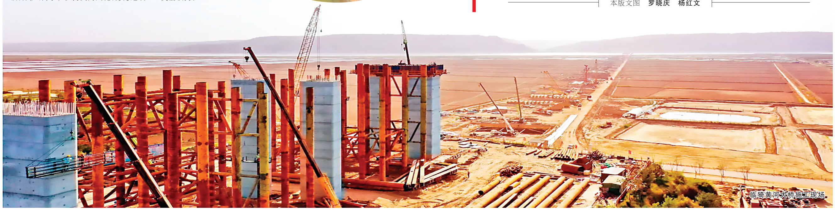
临猗黄河大桥施工现场