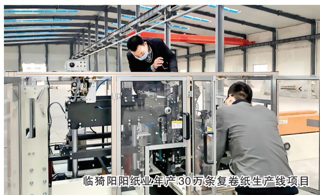
临猗阳阳纸业年产30万条复卷纸生产线项目