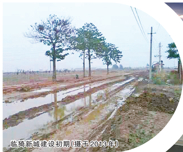
临猗新城建设初期(摄于2013年)