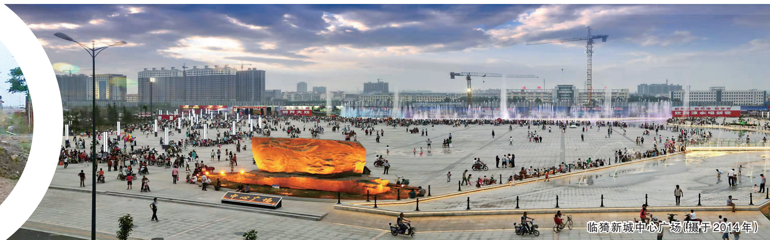
临猗新城中心广场(摄于2014年)