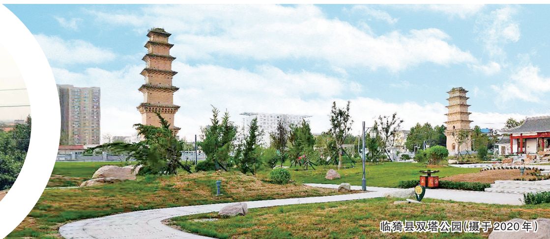
临猗县双塔公园(摄于2020年)