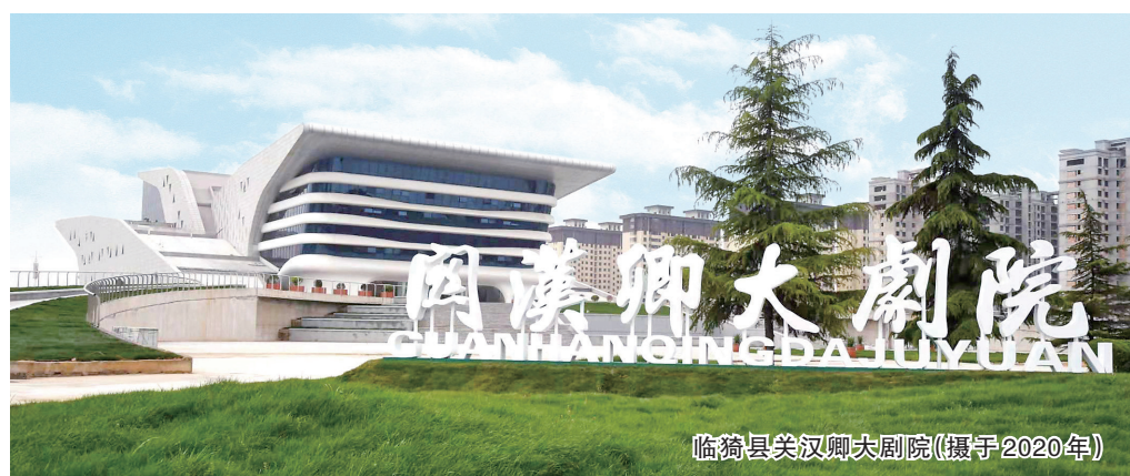
临猗县关汉卿大剧院(摄于2020年)

现在村里道路循环畅通、水电配备齐全，绿化林网形成，新建了荷花景观区、农业观光园等五大项目，村民日子也越过越好，贫困群众如期实现脱贫，村民幸福感和获得感不断提升。