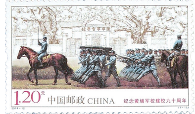
《纪念黄埔军校建校九十周年》邮票

1994年6月16日,国家邮政局发行《纪念黄埔军校建校七十周年》纪念邮票一套一枚,志号为1994-6J。