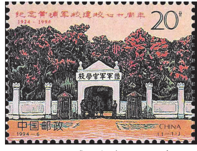
《纪念黄埔军校建校七十周年》邮票