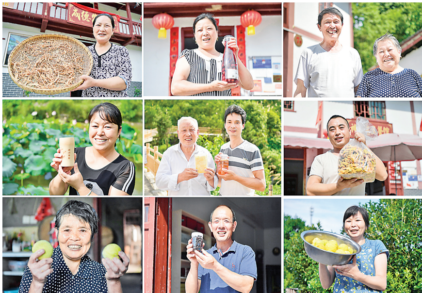
这是2020年7月15日拍摄的江西省井冈山市神山村村民笑脸合集(拼版照片)