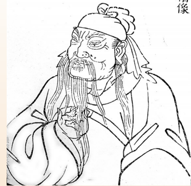
果亲王拜谒解州关帝庙亲笔指绘的关帝五十三岁真像(资料图片)

临颛海,深藏雄秀,实为诞生灵区。墓麓有关圣祖墓墓道碑。又里许有常平村古庙,相传为关氏祖宅,有塔屹立。金大定十七年,里人王兴重修,有碑记。每岁清明、十月朔,知州亲祭。塔下有井,俗称关圣避难出亡时,其父母葬于内,后人建塔表之。墓址东至黑嘴怀,西至发鼓台,南至青石坂,北至石梯子。”