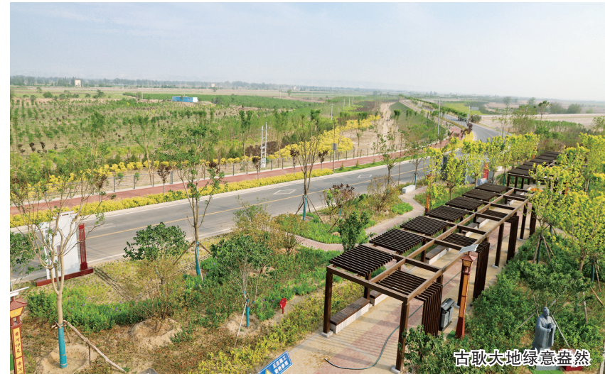
古歌大地绿意盎然

林”,这是“四荒”地植树造林普遍存在的问题。对此,该市今年聘请专业造林团队,传承弘扬大禹治水精神,采取多项措施,全力保证苗木成活率。与此同时,在“四荒”地苗木设计方面,该市林业部门多次和相关乡村对接,在保证生态效益的前提下,结合群众意愿,栽植连翘、花椒等经济效益好的树种。目前,相关栽植任务已全部完成,共栽植油松、侧柏、五角枫、榆树、连翘、花椒等各类苗木120余万株。