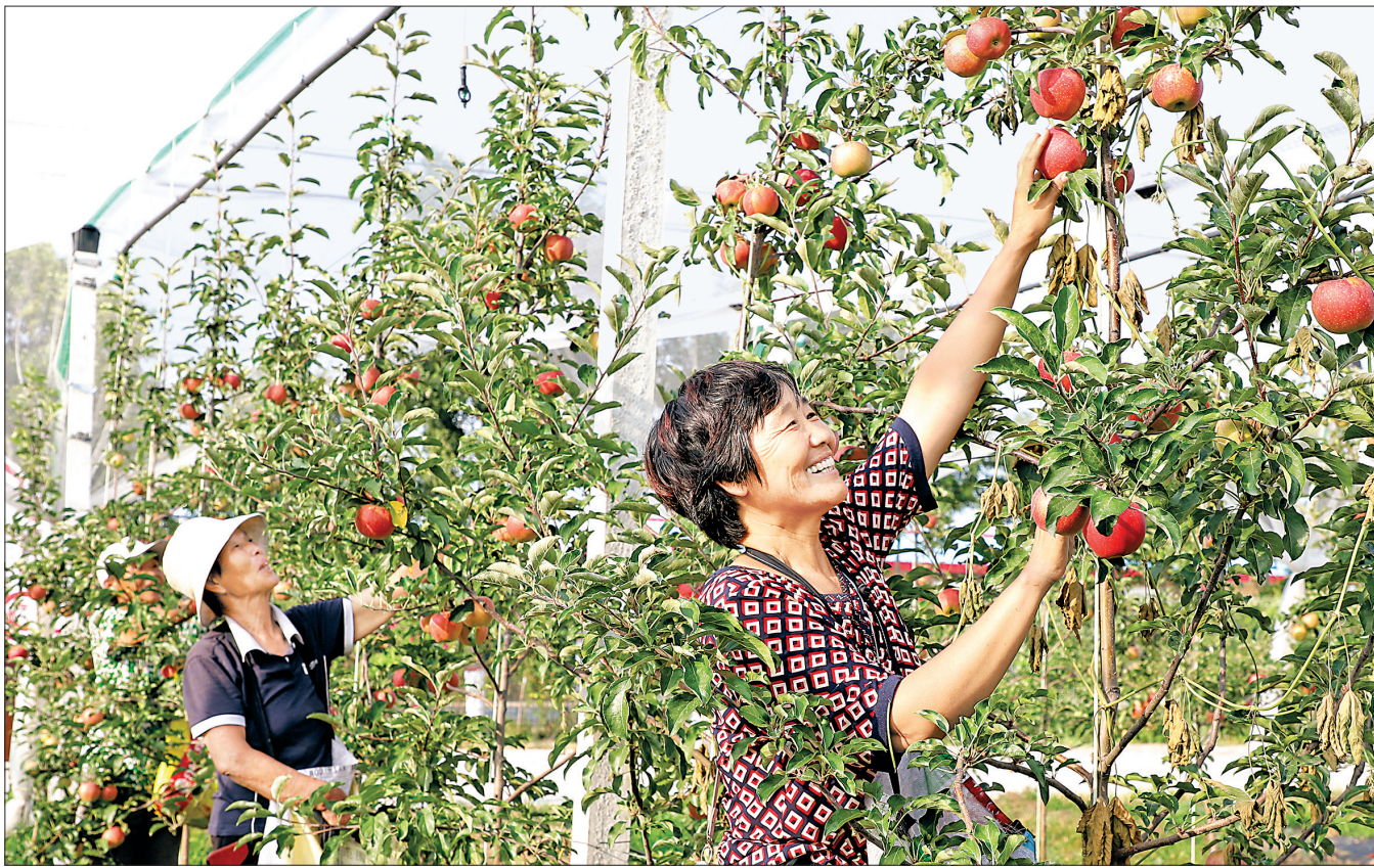
8月4日,在临猗现代农业产业园(北辛乡东卓基地),果农们在采摘新上市的“大卫嘎啦”苹果。该基地按照新品种、新技术、新模式“三新”管理方式进行栽培,突出临猗果品“早、晚、平”的特点,为该县果品业高质量转型发展树立了样板、蹚出了新路。

四组其他成员出席会议。会上,市人大常委会机关党委第一党支部书记代表党支部委员会报告了半年来党支部工作情况特别是开展党史学习教育情况,通报党支部委员会检视问题情况。党支部党员结合自身工作、学习和思想实际作个人检视剖析,并严肃认真开展批评和自我批评,共同过了一次严肃而有意义的党内政治生活。邓雁平与大家一起学习讨论、交流心得,一起接受思想教育和政治锤炼。他说,党史学习教育专题组织生活会对于锤炼党性、提升党员干部综合素质意义重大。(下转第三版)