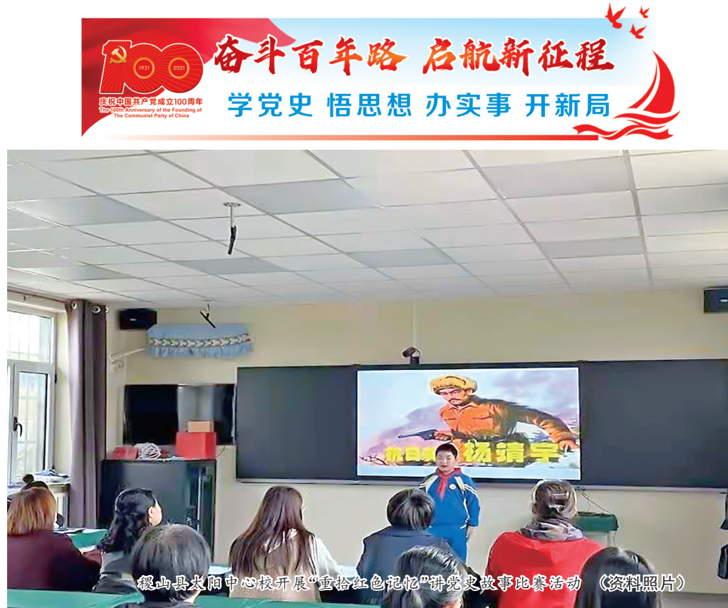
稷山县太阳中心校开展“重拾红色记忆”讲党史故事比赛活动 (资料照片)

在党史学习教育中，永济市职业中专学校紧扣主题主线，准确把握总要求和目标任务，精制自选动作，突出青少年党史学习教育这个特色亮点，推动党史学习教育走深走实、取得实效。该校充分发挥导游专业师生作用，对青少年进行看得见、摸得着、实实在在的党史学习教育，不仅在思想政治课，而且在历史、语文等科目，上课前3分钟讲党史，不仅教师讲，而且让学生讲，以党史学习教育进课堂带动全校师生学党史、知党史。