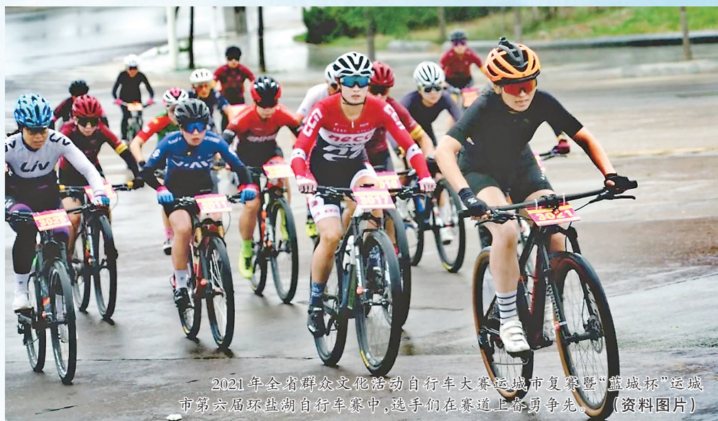
2021年全省群众文化体育活动自行车大赛运城赛区暨“蓝城杯”运城市第六届环盐湖自行车赛中,选手们在赛道上奋勇争先。(资料图片)

“我们将制定《运城市乡镇全民健身中心建设示范工程五年行动计划(2021—2025年)》建设标准,补齐城乡全民健身设施发展不充分、不平衡的短板。加强乡镇全民健身运动中心示范工程项目建设,推进和带动各县(市、区)乡镇全民健身运动中心工程建设,争取“十四五”末实现全市乡镇全民健身运动中心全覆盖,并继续完善全省大型公共体育