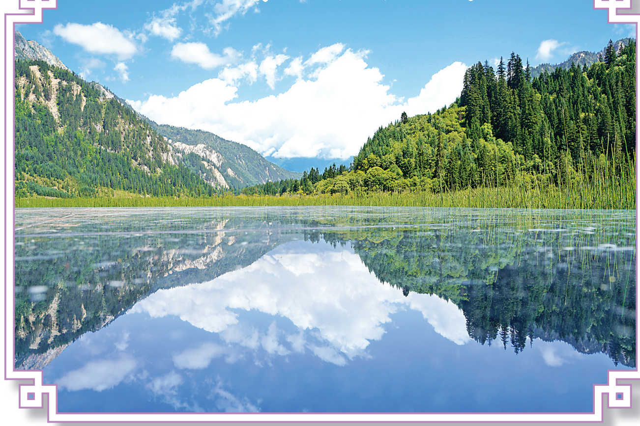
这是8月24日拍摄的九寨沟爱情海景区。初秋时节,四川九寨沟色彩斑斓,景美如画。