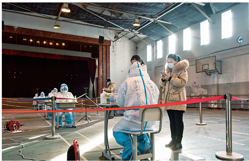
12月11日,在黑龙江哈尔滨市香坊区哈尔滨理工大学核酸检测点,市民在登记身份信息。 12月10日,哈尔滨市应对新冠肺炎疫情工作指挥部发布第46号公告,目前全市完成六个主城区四轮全员核酸检测,在前三轮检测中,共筛查出4例阳性感染者。该指挥部决定于12月11日8时,启动市区第五轮全员核酸检测。