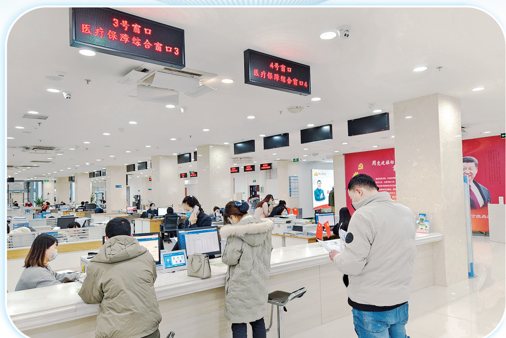
▲近日,市民在政务服务中心医保窗口办理相关业务。

目前,我市共有260家医药机构开通门诊费用跨省直接结算,13个县(市、区)全覆盖,网点数全省第一,已有13个省份人员在我市结算,提前完成国家目标任务。目前,作为参保