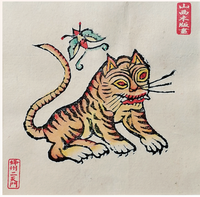
绛州二天门木版年画社印制的 虎年主题木版画(资料图片)