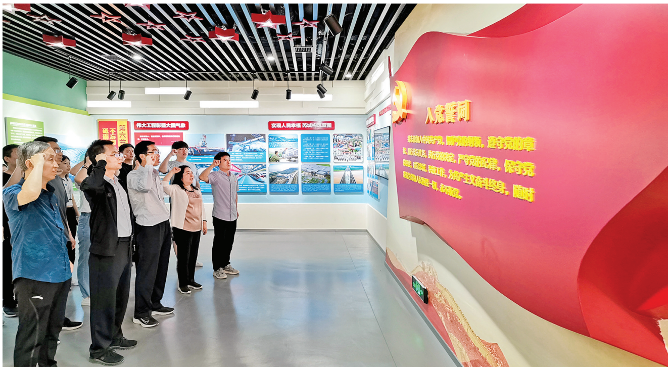
2021年6月9日,市金融办党员干部在芮城县党员干部理想信念教育基地重温入党誓词(资料照片)。