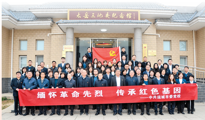
图为市委党校组织教职工赴闻喜县陈家庄村，开展清明祭奠英烈暨红色主题教育活动，缅怀革命先烈，传承红色基因（资料图片）。

进党风廉政建设和反腐败斗争。要不断加强学习，提高思想觉悟，增强不想腐、不敢腐的自觉，坚决把“两个维护”作为最高政治原则和根本政治责任，以强有力的政治监督确保党中央、省委、市委、县委决策部署贯彻落实到位。要健全完善组织，进一步加强局机关纪检监察机构和纪检委员自身建设，确保执纪执法权力得以规范正确行使。