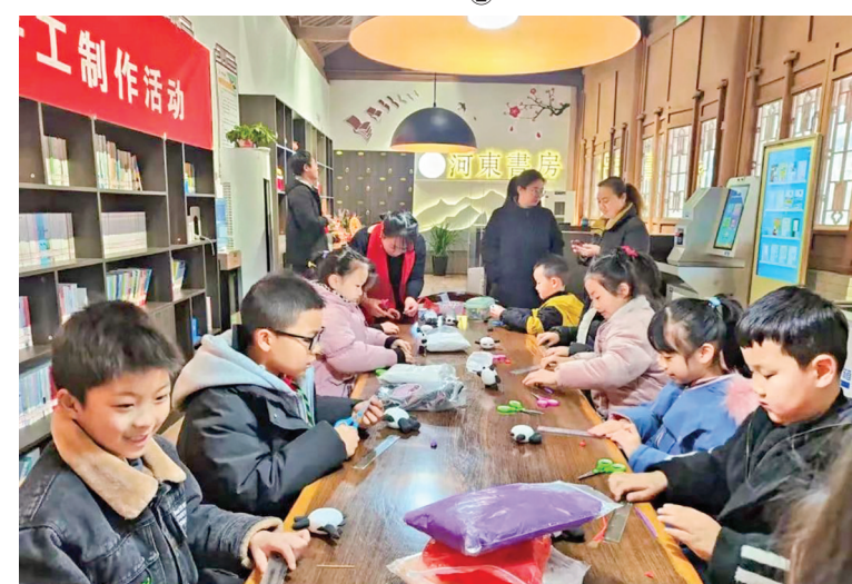
非遗手工制作活动现场