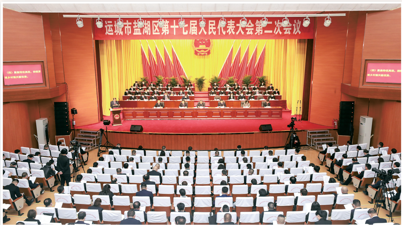
1月25日，运城市盐湖区第十七届人民代表大会第二次会议隆重开幕。