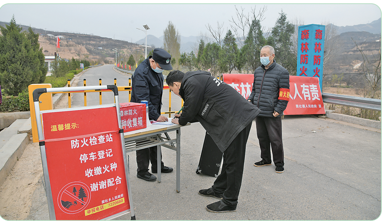
3月21日,闻喜县裴社镇金元村农家防火站工作人员,在对进山人员进行严格登记和检查。当前,正值森林防火特险期。该镇坚持“打防结合、以防为主”的原则,全镇动员,全民动手,强化森林防火宣传、防火责任落实、应急队伍建设、防火信息上报,全力做好春季及清明节期间森林防火工作。