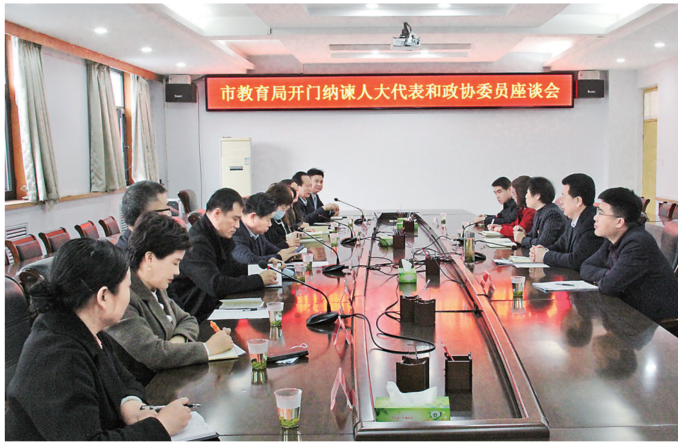
市教育局邀请市人大代表、政协委员上门提意见 资料图片