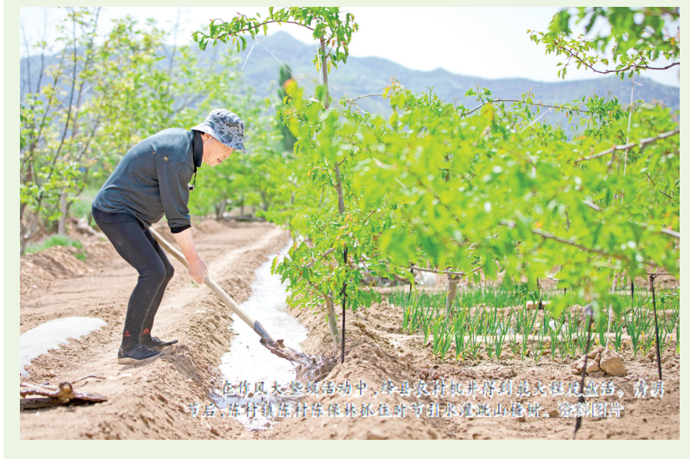
在作风大整顿活动中，绛县农村机井得到全面检修改造。春耕开始后，各村镇村干部确保抓住春耕农时不误农时。

三四月，草长莺飞，春意盎然。为了不耽误农时，绛县纪委监委以党员干部作风大整顿为契机，聚焦农村一线，紧盯春耕生产，对农村浇地、作物种植、干部管理等进行全过程监督，持续深入推进“我为群众办实事”实践活动，以实实在在的成效检验作风整顿的成果。