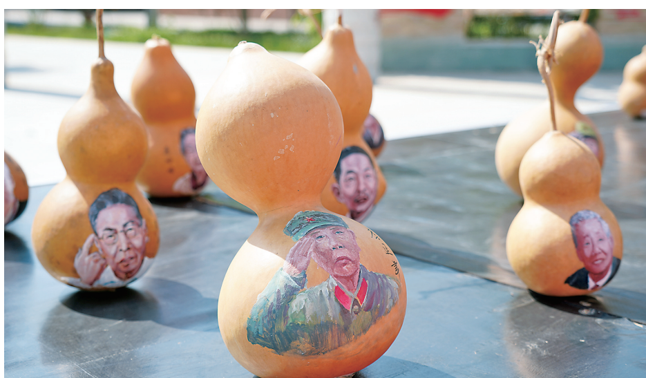
为进一步加强全面建设清廉永济工作力度,永济市持续推进清廉文化进校园,通过清廉作品展览、主题班会、师生互动等形式,帮助学生们树立正确价值观,扣好人生第一粒扣子。图为永济市城西初中学生制作的廉洁系列葫芦手工作品。

程抓实选人监督。细化“六查”程序,压紧压实部门职责,坚决防止“带病提拔”。同时,结合十五届夏县县委第二轮巡察工作,对10个被巡察单位开展选人用人专项检查,进一步推动干部选任工作规范化、标准化、科学化。三是在“细”字上发力,久久为功抓好日常监督。充分发挥“12380”举报电话、网络、短信、信访“四位一体”干部监督体系作用,把干部日常监督从“工作圈”向“社交圈”“生活圈”延伸,常态化筑牢监督“防火墙”。(王京杰 王泽敏)