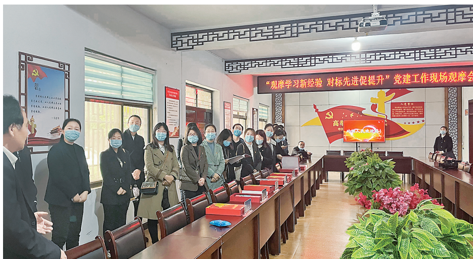
为促进基层治理能力提升,深化拓展“五面红旗”示范机关(单位)创建工作,5月9日,垣曲县直工委组织各党委(党总支、党支部)负责人,赴去年“五面红旗”示范社区南城社区、“五面红旗”示范村皋落乡岭回村,开展主题党日活动观摩活动。

点村,由县乡村三级集体经济专班逐村集中会审,靶向定策,科学制定规划,协调职能部门支持。三是跟踪问效,考核评价。县工作专班建立试点村工作台账,量化考核指标,强化过程管理,坚持“月中调度、双月通报、半年观摩、年底评比”,及时推荐上报典型案例,压紧压实工作责任。四是政策导向,奖惩激励。将集体经济考核结果与星级评定、考核奖励和干部报酬直接挂钩,奖励先进。(梁晋杰 王国帅)