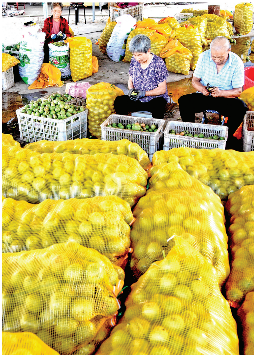
7月18日,在垣曲县保乐农业开发有限公司,员工对收购的新鲜青皮核桃进行去皮。

市妇联相关负责人表示,今后将持续开展形式多样的活动,进一步弘扬中华优秀传统文化,厚植少年儿童的爱国情怀,通过丰富多彩的活动将对党和祖国的忠诚与热爱这颗红色种子深深根植于孩子们的内心,让祖国的花朵在新时代阳光下茁壮成长。