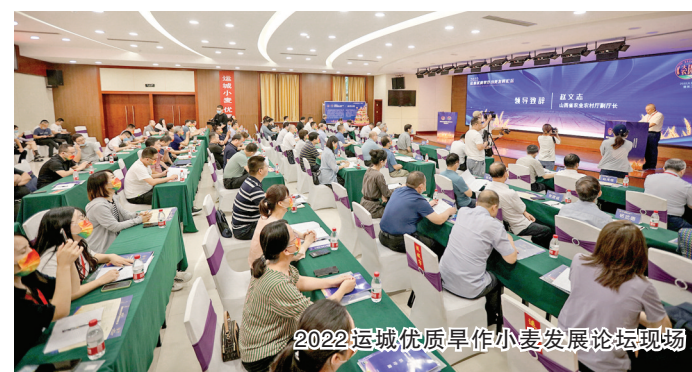
2022 运城优质早作小麦发展论坛现场