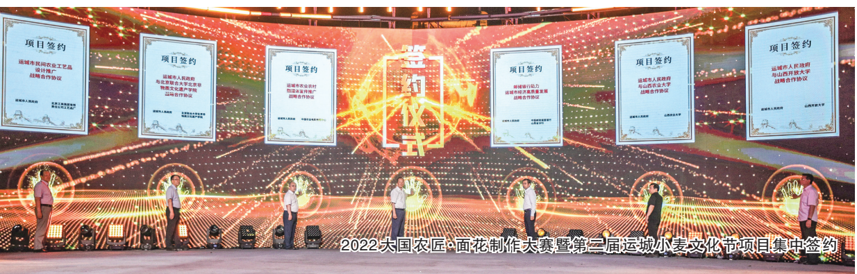
2022 大国农匠·面花制作大赛暨第二届运城小麦文化节项目集中签约