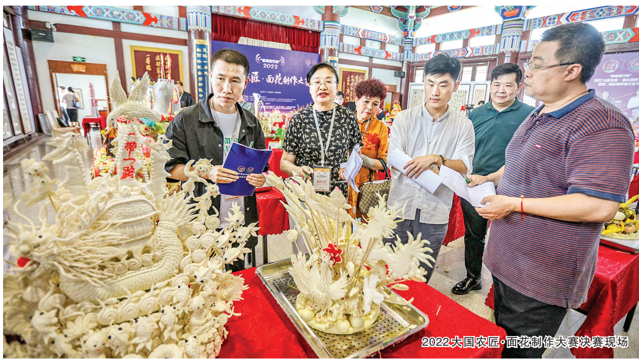
2022 大国农匠·面花制作大赛决赛现场

论坛期间，原国家粮食储备局局长、党组书记高铁生，中国农业大学原校长柯炳生，中国小麦育种专家、中国农业科学院作物科学研究所研究员景蕊莲，小麦栽培专家、山西