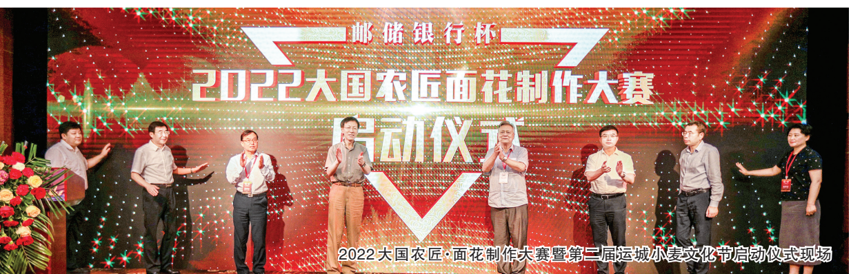
2022 大国农匠·面花制作大赛暨第二届运城小麦文化节启动仪式现场