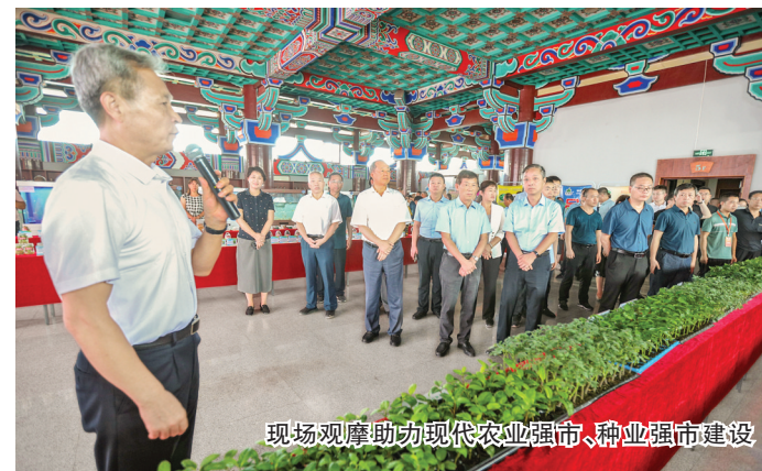
现场观摩助力现代农业强市、种业强市建设