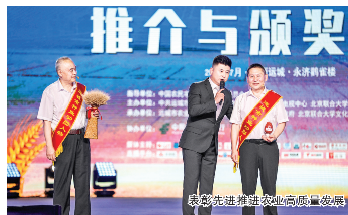
表彰先进推进农业高质量发展