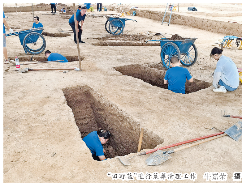
“田野蓝”进行墓葬清理工作

市文保中心考古研究所负责人李金霞说:“本次技能培训与招聘面试相结合,不仅从实处考察了学员们的理论知识、实践技能,并且让他们对考古工作有进一步的了解和认知,从而切实加强考古人才队伍建设,提升考古工作水平和服务大局的能力。”