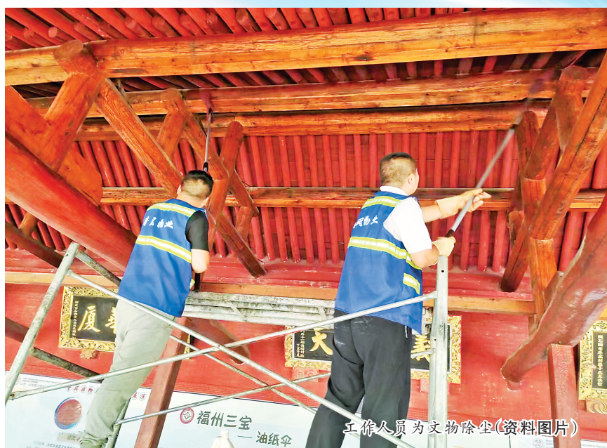
工作人员为文物除尘(资料图片)

傅文元说:“如今在除尘的同时,也要对文物进行观察和监测,以便采集数据。这些数据在若干年后仍有参考价值,可以留待后续的保护工作使用。它还可以帮助人们更好检查文物出现或潜藏的问题。”例如一些古建筑木料腐蚀、结