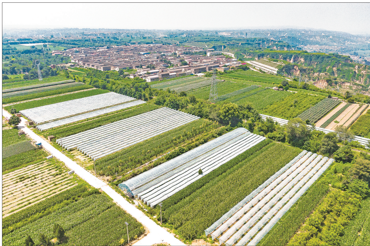
天津市小梁乡刘村水果产业示范基地是省乡村振兴局确定的2022年省级特色产业示范基地创建项目,也是该村党支部实施“党建+”的一项重大举措。该项目投资300万余元,采用“基地+合作社+农户”的运营模式,以农

况,进一步完善接待、宣传、疫情防控等专项工作方案,把各项工作做细、做实、做到位,确保大会系列活动安全、有序、顺畅进行。要树牢“一盘棋”思想,加强统筹协调、沟通交流,做到信息互通、工作互助,形成运转有序、高效顺畅的工作格局,以高度的责任感、使命感做好各项服务工作,让与会嘉宾留下美好的运城记忆,全面展示运城良好形象。