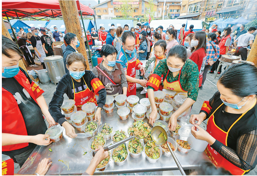
9月7日,志愿者在泸定县磨西镇为人们分餐。

当日,一些志愿者在四川省甘孜州泸定县磨西镇制作炒菜、米饭、面条等食物,大部分食材由政府提供,少部分食材为志愿者捐赠,免费提供给在这里安置的群众。