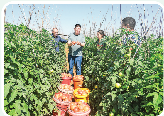
▲南白石反季节蔬菜