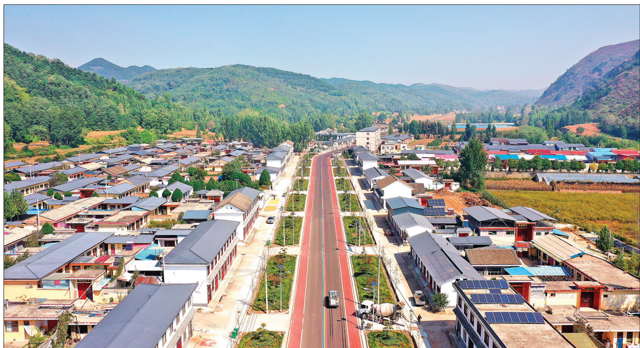
9月25日,夏县泗交镇窑头村,穿村沿黄旅游“彩虹”公路、沿街高标准绿化带、错落有致的民居与绵延起伏的群山共同构成一幅绿色生态新农村画卷。特约摄影 张秀峰 裴国峰 摄影报道

受到家乡日新月异的变化,进一步增进了文化认同和心灵契合。参访团成员纷纷表示,将尽所能,用真心为晋台交流交往、创业发展、求学安居搭建更为广阔的平台,当好传播幸福的纽带,为深化晋台交流交往、促进两岸关系和平发展作出新贡献。(王杨)