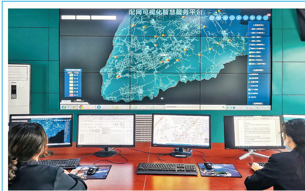
连日来,国网运城城区供电中心全面开启24小时联动值班的“战时”状态,坚决扛起供电保障责任,全力以赴保民生、保供电、保稳定。该中心对防疫用品生产企业、民生保障单位等场所组织专人开展隐患排查治理、供电保障巡查。同时,统筹优化抢修力量,安排抢修人员、车辆24小时待命,确保“最短时间出险、最短时间到达、最短时间恢复供电”。图为记者昨日拍摄的一组镜头。

流调溯源、隔离管控等疫情防控措施,坚决阻断疫情传播风险。交通卡口要继续加强管理,认真做好入临货车司乘人员“落地检”、中高风险地区人员返临入临严格排查管控等工作,坚决把牢守好“外防输入”关口。要强化服务保障,提高通行效率。要把人民群众基本生活保障放在心上,增加物资储备供应,及时补充生活必需品,确保各类物资供应有序、保障充足。要健全完善工作机制,加强应急指挥调度,保持指挥体系高效运转,确保精准科学高效开展疫情防控工作,全力以赴守牢临猗阵地。