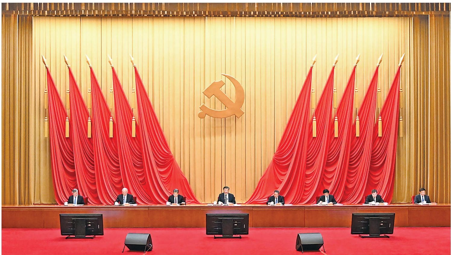
4月3日，学习贯彻习近平新时代中国特色社会主义思想主题教育工作会议在北京召开。中共中央总书记、国家主席、中央军委主席习近平出席会议并发表重要讲话。李强、赵乐际、王沪宁、蔡奇、丁薛祥、李希、韩正出席会议。

新华社北京4月3日电 学习贯彻习近平新时代中国特色社会主义思想主题教育工作会议3日在北京召开。中共中央总书记、国家主席、中央军委主席习近平出席会议并发表重要讲话。他强调，强国建设、民族复兴的宏伟目标令人鼓舞、催人奋进，我们这一代共产党人使命光荣、责任重大。我们要以这次主题教育为契机，加强党的创新理论武装，不断提高全