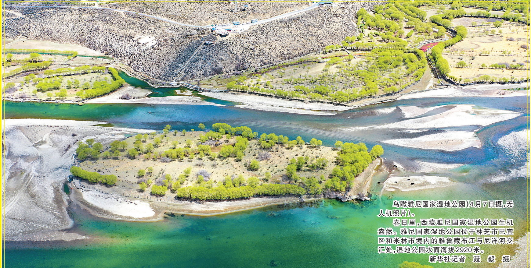
鸟瞰雅尼国家湿地公园(4月7日摄,无人机照片)。春日里,西藏雅尼国家湿地公园生机盎然。雅尼国家湿地公园位于林芝市巴宜区和米林市境内的雅鲁藏布江与尼洋河交汇处,湿地公园水面海拔2920米。