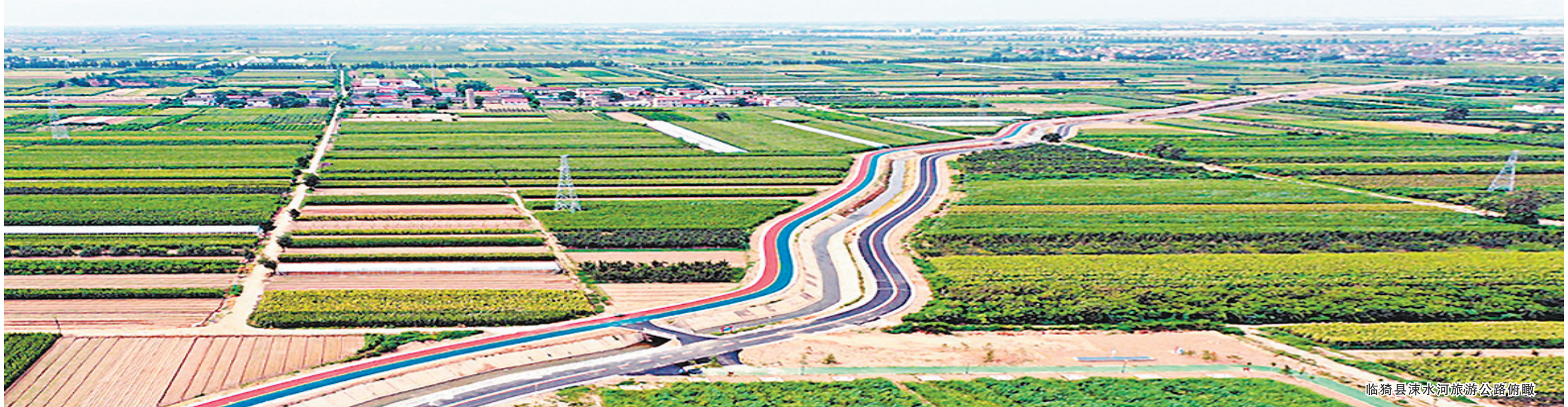
临猗县涑水河旅游公路俯瞰