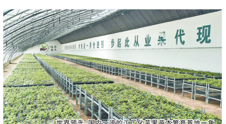
世界领先、国内一流的工厂化苹果苗木繁育基地一角