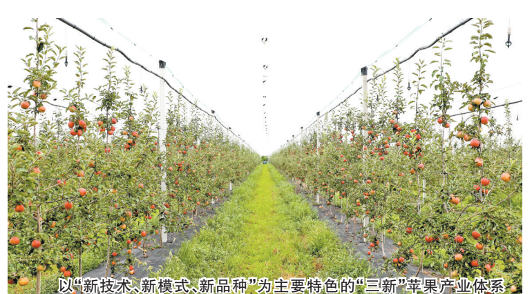
以“新技术、新模式、新品种”为主要特色的“三新”苹果产业体系