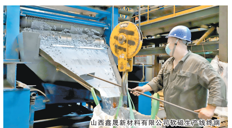
山西鑫晨新材料有限公司软磁生产线终端