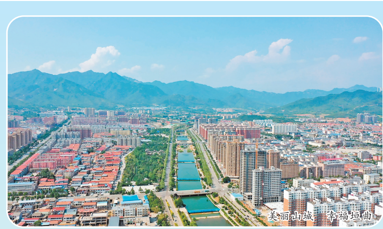
美丽山城 幸福垣曲