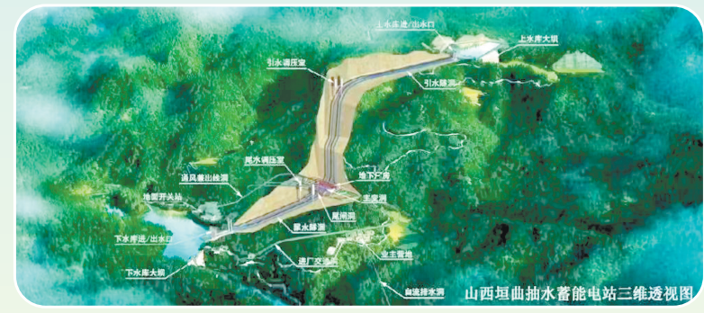
山西垣曲抽水蓄能电站三维透视图