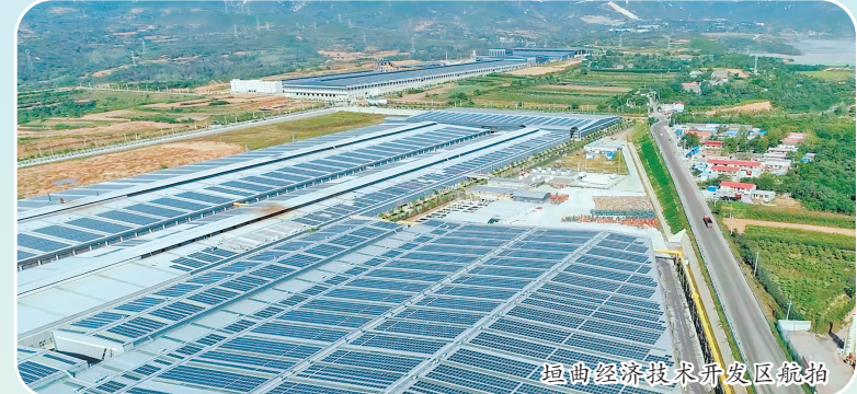
垣曲经济技术开发区航拍