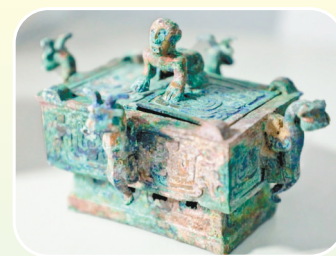
垣曲北白鹅墓地出土铜壶