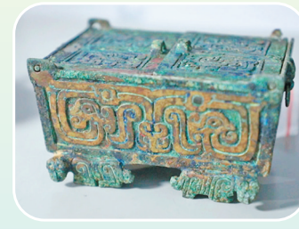
垣曲北白鹅墓地出土铜壶