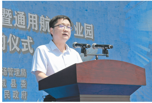
芮城县委书记尚玉良致辞