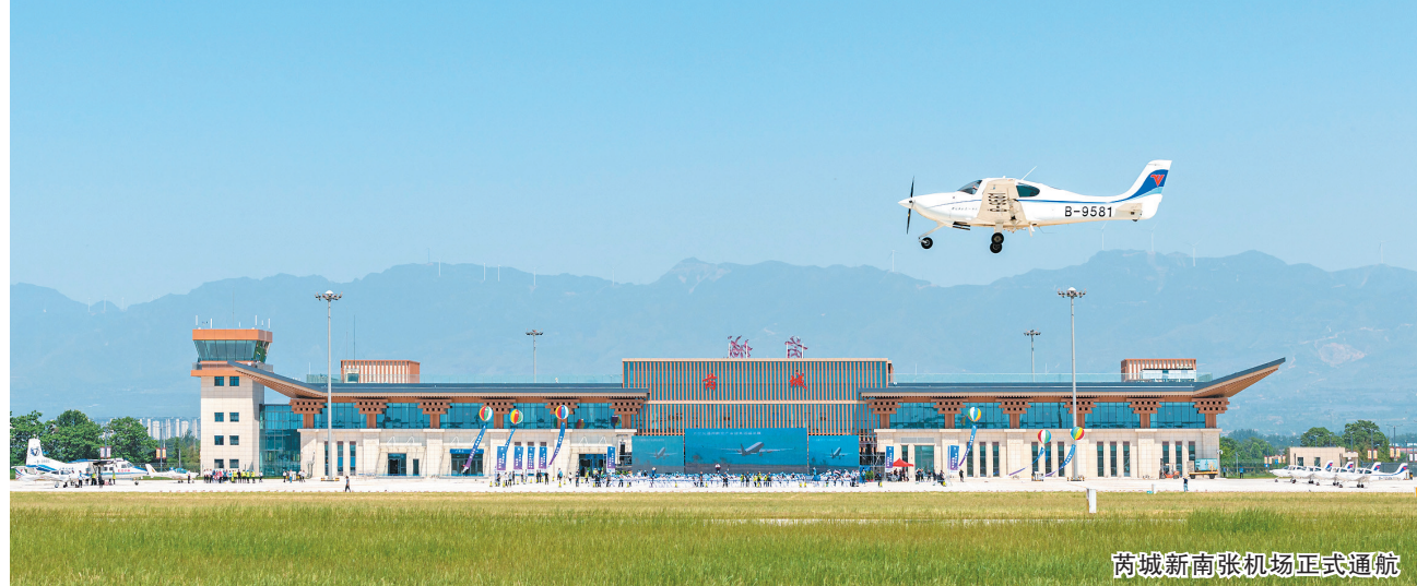
芮城新南张机场正式通航