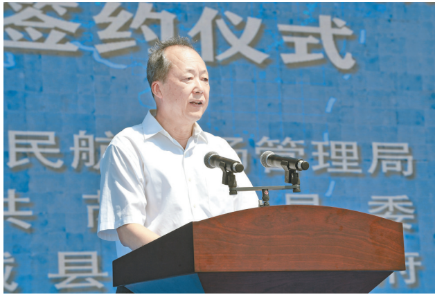
市委常委、副市长董旭光讲话