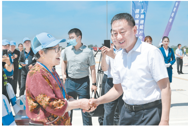
副省长刘阳出席活动