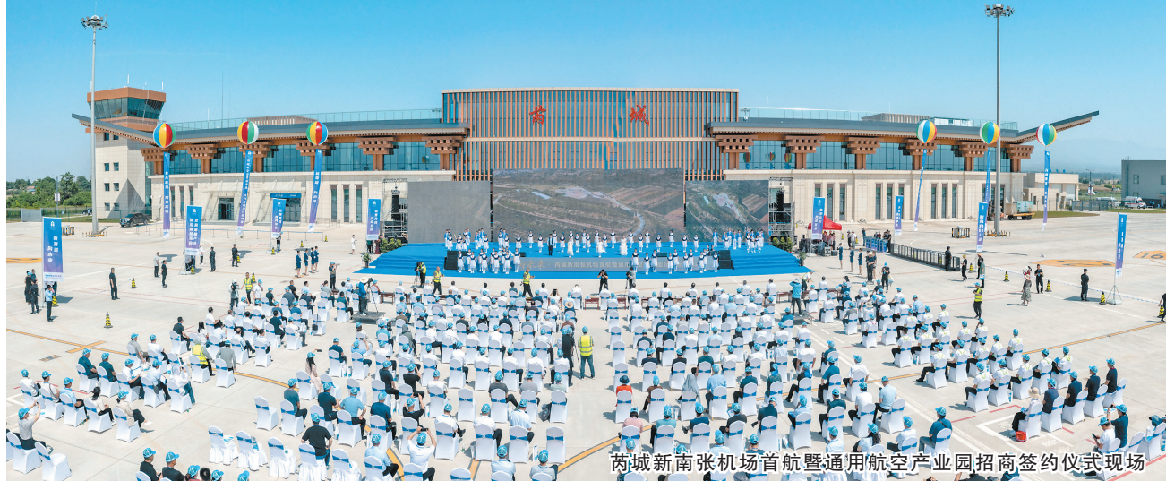
芮城新南张机场首航暨通用航空产业园招商签约仪式现场