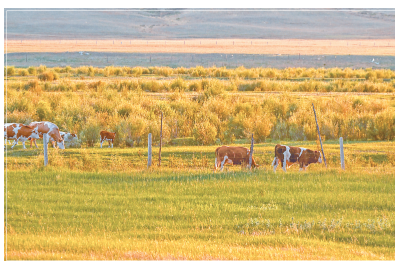
6月14日，牛群在草原上觅食。夏日，内蒙古阿鲁科尔沁草原绿意盎然，牛羊在草原上觅食，景色如画。

——坚持创新驱动，在推动产业转型升级上作示范。要以新稷闻工业转型发展区为主战场，支持企业加大高端化、智能化、绿色化技术改造和设备投入力度，推动传统产业内涵集约发展。要谋划布局生命科学、人工智能、光电科技、数字经济等未来产业，着力提升产业链现代化水平。要培育引进一批龙头企业，加快发展果品蔬菜、饮品酿品、主食糕点、药材药品、肉蛋制品五大产业集