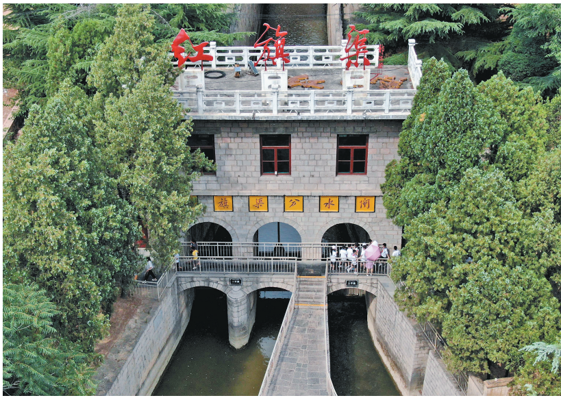
游客在河南省林州市红旗渠分水闸参观(2019年7月4日摄,无人机照片)。

红旗渠开工之初,林县的水利技术人员还不到30人。但修渠10年,林县儿女设计了“坝中过渠水、坝上流河水”的空心坝,建成了“槽下走洪水、槽中过渠水、槽上能行车”的渡桥,创造