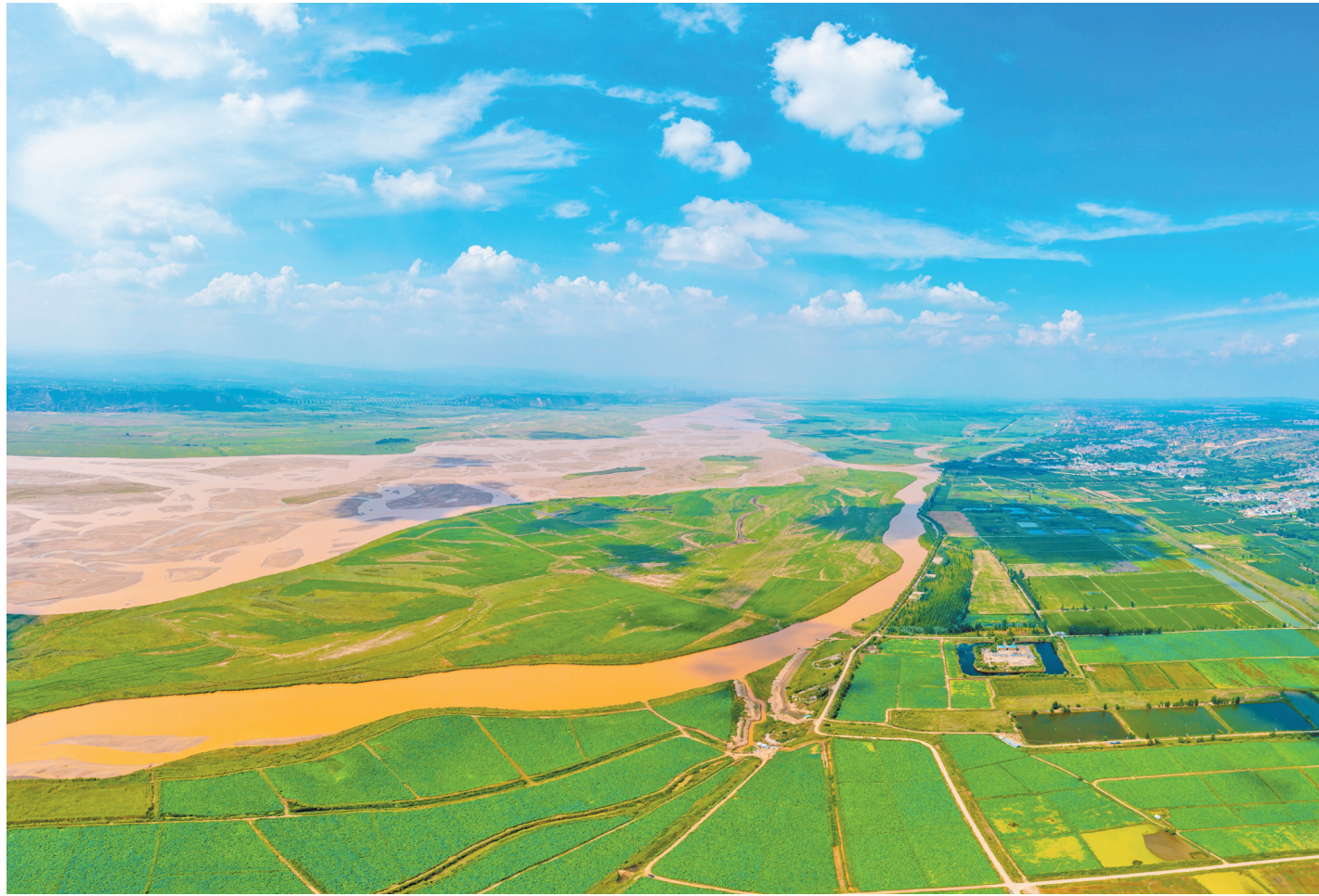
7月26日,万荣县境内黄河沿岸生机勃勃,河床在水流冲刷下纵横交错,与蓝天白云交相辉映,构成一幅壮美的生态画卷。

市安委办要求,各行业领域监管部门要针对本行业领域特点,制订具体执法检查方案,明确重点检查内容和事项,特别是要针对企业主要负责人重点任务落实情况精准严格执法。要坚持逢查必考原则,对企业主要负责人和管理人员学习掌握本行业领域重大事故隐患判定标准或重点检查事项情况进行抽考。检查要做到检查名单企业全覆盖、重点场所全覆盖,重点执法检查内容全覆盖。