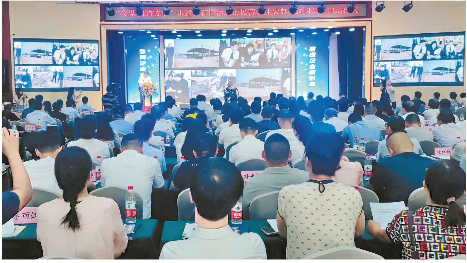
“父辈们的故事”年轻一代企业家讲述暨“晋商精神在运城”首届运城民营企业企业家典范选树活动启动仪式现场