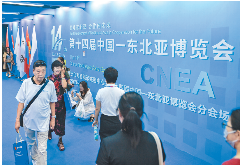
人们在第十四届中国—东北亚博览会现场参观(8月24日摄)。

合作共识背后,是东北亚地区经贸领域的累累硕果。国际局势纷繁复杂、全球经济压力持续加大的背景下,东北亚区域贸易规模始终保持增长。2022年,中国与东北亚五国贸易额共