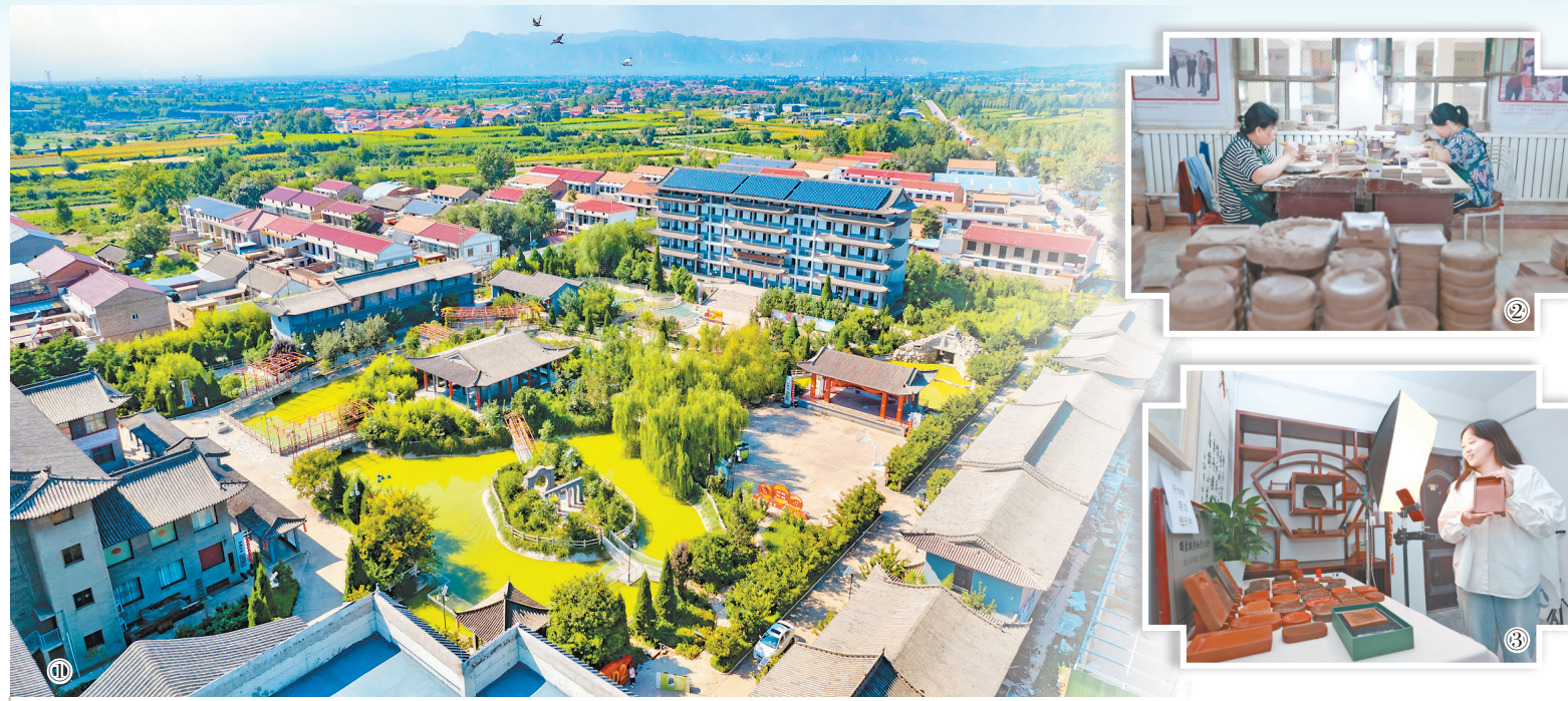
图① 绛州澄泥砚文化园俯瞰图。图② 技术人员在精心修缮绛州澄泥砚。图③ 女主播在直播销售绛州澄泥砚。