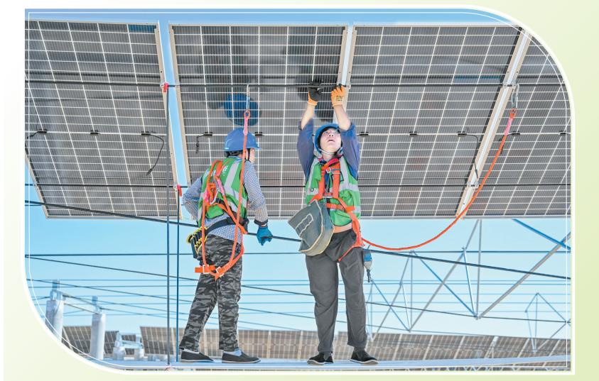
2023年7月22日,工人在位于内蒙古杭锦旗库布其沙漠亿利生态示范区的蒙西基地库布其200万千瓦光伏治沙项目工地安装光伏板。