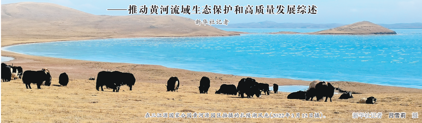
在三江源国家公园黄河源园区拍摄的扎陵湖风光(2022年3月12日报)。