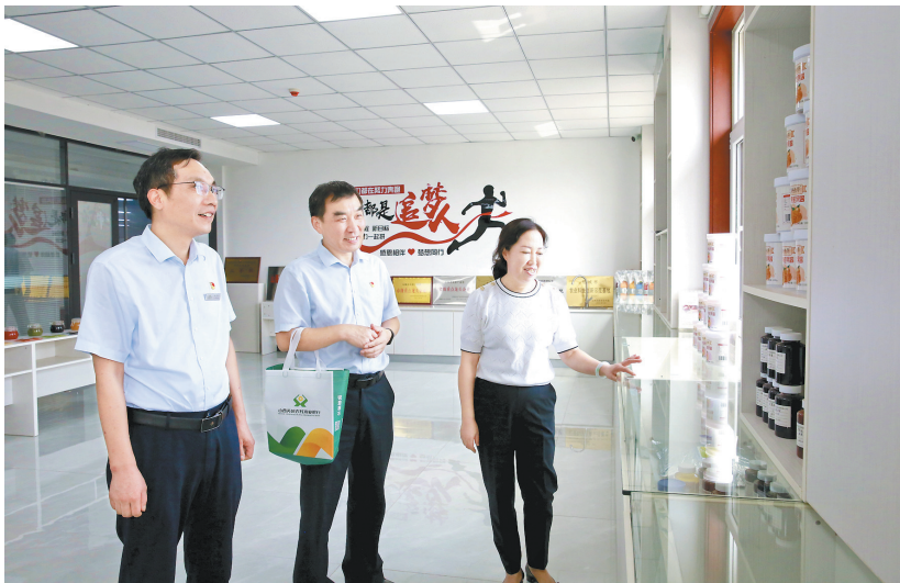
芮城农商银行工作人员在弘美华了解企业产品生产情况。

户,打开好的市场。目前,弘美华的产品主要销往伊利、光明乳业、新希望乳业等全国知名大型企业。